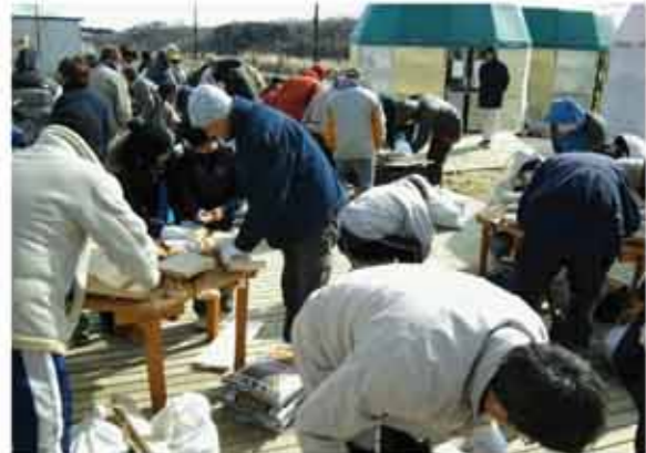
プランターに使った木はいわき市沿岸部で被災したマツ。皮を削り、放射性物質の問題をクリアしました。