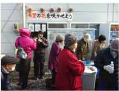
黙祷や焼きそばの焼き出し、ギターコンサートが行われました。3月11日は広野町の浅見川河岸で鎮魂の火を灯すイベントが開催されます。

また、2月18日(土)は総勢50人近くが参加し、裏務棟でスキー教室が行われました。普段、放課後に広野町の仮設住宅入居の子と借り上げ住宅入居の子と一緒に遊ぶことがほとんどできないため、今回の企画はみんなで遊ぶ良いチャンスにもなったようです!