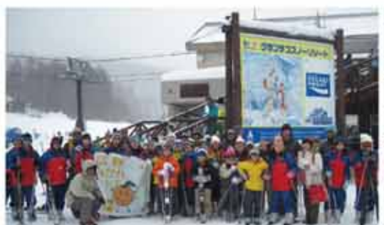
筑波大学の学生さん2名がスキー講師として同行。参加した子どもたちからは「楽しかった!」「滑り足りない!」との声。

広野みかんクラブ 活動報告 3・11より1ヶ月早い2月11日(土)午前10時、東日本大震災犠牲者を追悼する「中央台自治会鎮魂祭」が高久第4仮設住宅で厳かに開催されました。