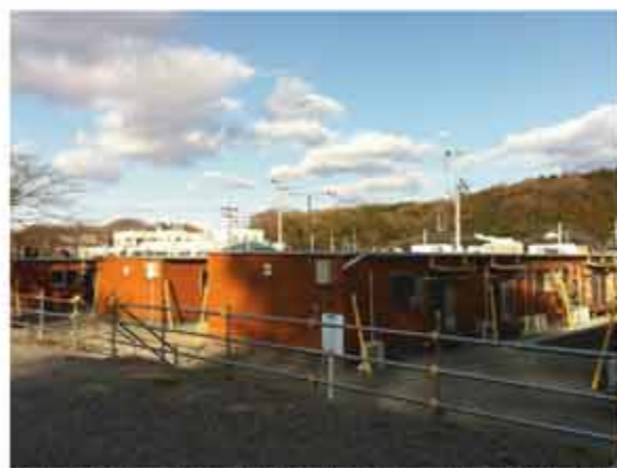
道路を挟んで西側の仮設住宅は一部ウッドデッキが設置されているなど、コテージのような温かみのある外観でした。

ご予約・お問い合わせは 080-3303-4259 (電話受付時間 平日10時~17時)