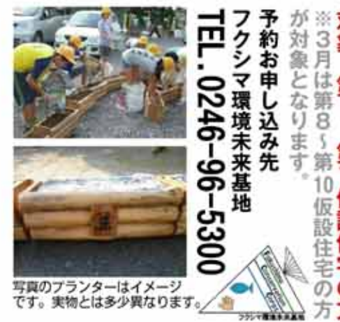
写真のプランターはイメージです。実物とは多少異なります。

花に囲まれた明るい住宅地になったらいいなあ。春に向けて、お花を育てていけるように、私たちと一緒にプランター作りをしてみませんか?ぜひご参加お待ちしております。完成したプランターは土と花の種もセットでお持ち帰りできます。作った後は宇都宮餃子の名店「みんな」の水餃子をご用意いたします!お楽しみに。 2月12日(日)11時~13時 60名 予約制 無料 パオ広場 対象:第1~第7仮設住宅の方 ※3月は第8~第10仮設住宅の方が対象となります。 予約お申し込み先 フクシマ環境未来基地 TEL.0246-96-5300