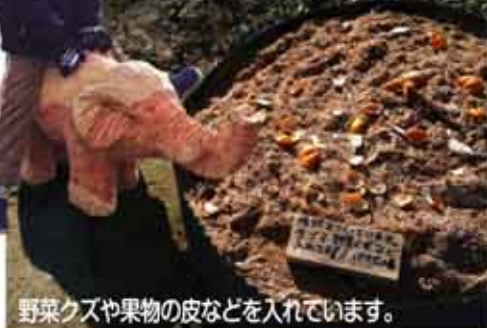
野菜クズや果物の皮などを入れていきます。 パオ農園にコンポストを設置しました。木のバオ象が見守っています。

家庭菜園(1区画200㎡×10名)始めたい方集まれ! 避難生活者の方対象。経費無料。農作業日当あり。 説明会:2月8日(水)10時~17時 パオ広場にて