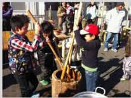
餅つき大会が行われました。子どもたちも参加。