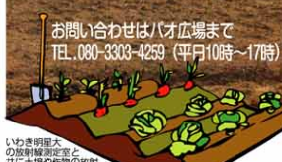
いわき明星大の放射線測定室と共に土壌や作物の放射線量を厳しくチェックしながら進めていきます。