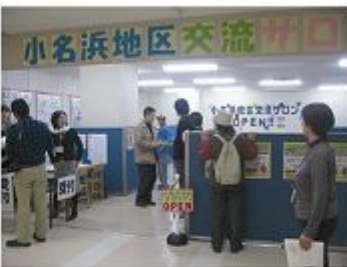
場所は、いわき市小名浜字桜川南5-6。リスポの2Fです。お買い物がてら、一度のぞいてみてはいかがでしょうか。

11月13日、小名浜タウンセンターリスポ内に「小名浜地区交流サロン」が開業されました。このサロンは、被災された方々が地域のなかで孤立することのないように、いつでも、どなたでも好きなときに立ち寄って、お友だちと一緒におしゃべりをしたり、また様々なイベント情報も受け取ることが出来ます。利用時間は10時～16時(水曜定休)です。お気軽にご利用ください。