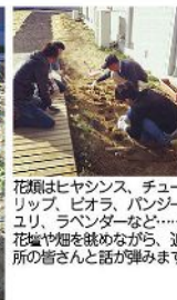
花類はヒヤシンス、チューリップ、ピオラ、パンジー、 ユリ、ラベンダーなど……、 花壇や畑を眺めながら、近 所の皆さんと話が弾みます。