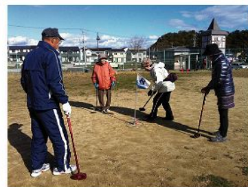
寒さもなんのその! 皆さん笑顔に遊んでいました。体を動かすとスッキリしますね。

中央台の山口公園で水・木の9時~11時、中央台の仮設住宅に住む方々を中心となってグランドゴルフを楽しんでいます。多い時で50人以上が参加されるそうで、人数が増えたため今月から植葉と広野にチーム分けをするとのこと。あちこちで歓声が上がリ、熱狂している様子がうかがえます。