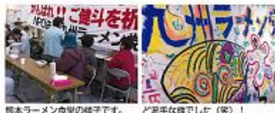
熊本ラーメン食堂の様子です。