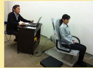
計測時はリラックスして椅子に深く腰かけていればOKです。

いわき放射能市民測定室 小名浜花畑町11-3 カネマンビル3F 定休日 毎週木・日・祝祭日 開所時間 9時~17時 直接来室予約受付時間 11時~15時 0246-92-2526 (電話&FAX) http://www.iwakisokuteishitu.com/