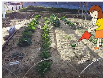
野菜類はタマネギ、ネギ、キャベツ、ニンニク、ホウレン草、 ミスズ菜、ソラ豆、エンドウ豆、菜花など……。